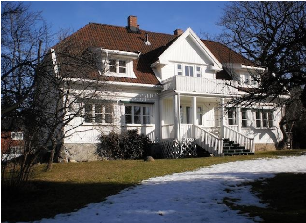
Furu gård, våningshus. I dag Furuveien 14A, 1356 Bekkestua.