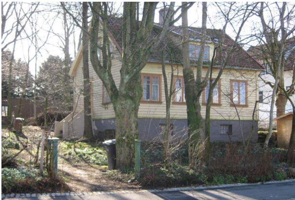
Steingata 70 i 2012 (Foto: RF)

Mange vil ha lagt merke til denne bygningen som ligger like bortenfor inngangsporten til krematoriet i det nordvestre hjørnet av Eiganes gravlund. Huset bærer preg av å være gammelt; det finnes angitt samme sted på et kart over Egenæs-løkkene i 1860-årene, som våningshus på løkke D2. Syd for dagens inngjerdete eiendom finner vi en brakke for kirkegårdens personale; for hundre år siden lå det både forpakterbolig, fjøs og låve på dette området med matrikelnr. Egenæs 74 . En periode utpå 1900-tallet hadde også eiendommen adresse til Stokkaveien. Det gikk nemlig en lang oppkjørsel derfra og oppover til bygningen, i og med at hverken Steingata eller Brønngata på den tiden var opparbeidet så langt vestover.